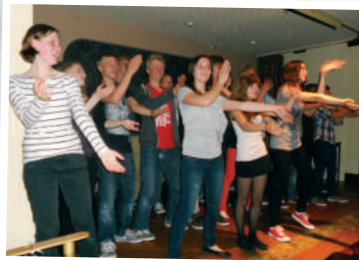
Club Night...We can dance!