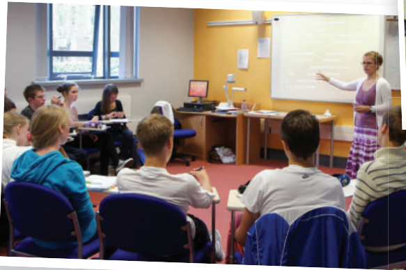
Over 30 hours teaching in small classes.

Außerdem bieten wir zahlreiche Sport- und Abendveranstaltungen, so dass bestimmt keine Langeweile aufkommt und die Jugendlichen fast rund um die Uhr betreut sind. Dabei ist es uns wichtig, dass die Teilnehmer so oft wie möglich aus verschiedenen Freizeitangeboten wählen können, um verschiedenen Interessen gerecht zu werden. Wir unterscheiden deshalb zwischen Gruppenaktivitäten für alle Teilnehmer (diese beinhalten z.B. alle Ausflüge) und wählbaren Aktivitäten.