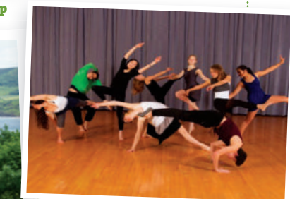
Fancy dance dance in Bootham School's dance studio?