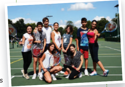
Fancy a game of tennis on Bootham School's tennis courts?