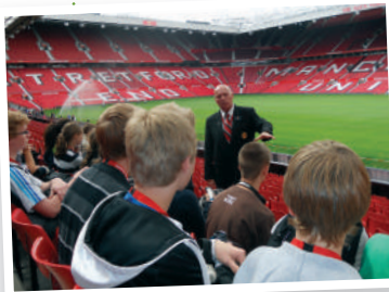
Manchester United Football Club