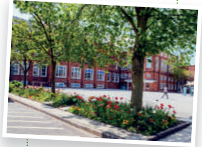
Bootham School... Hogwarts!!