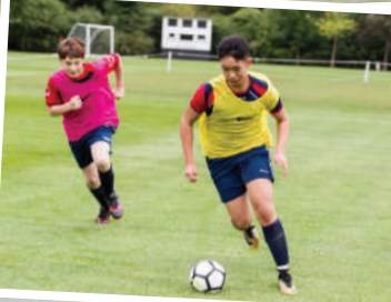
Fancy a game of football on Bootham School's pitches?