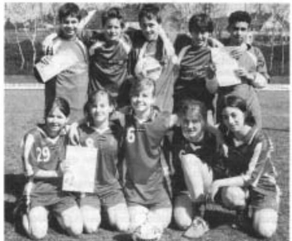
Das Geschwister-Scholl-Gymnasium vertritt Düsseldorf beim Landesfinale. Ebenfalls dabei: Die Schülerinnen des Humboldt-Gymnasiums.

Trotz aller Fairness fordert der Sport allerdings manchmal seine Opfer: Ein Schüler des Lessing-Gymnasiums musste mit einer Sprunggelenks-Verletzung ins