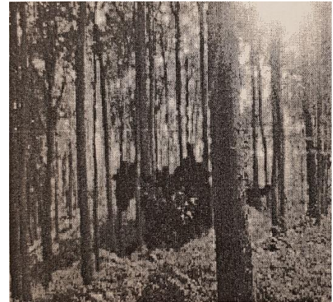
Das einzige Foto von dem Tier: unscharf und verpixelt

Unklar ist auch, ob das Tier einen freundlichen oder böartigen Charakter hat. Experten vermuten jedoch, dass keine Gefahr von dem Tier ausgeht.