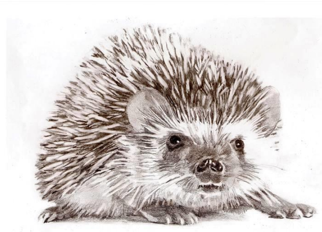
Igel – stachelig kurze, spitz auslaufende Linien