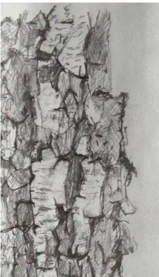
Baumrinde – kantig, ungleichmäßig, Linien verlaufen kreuz und quer